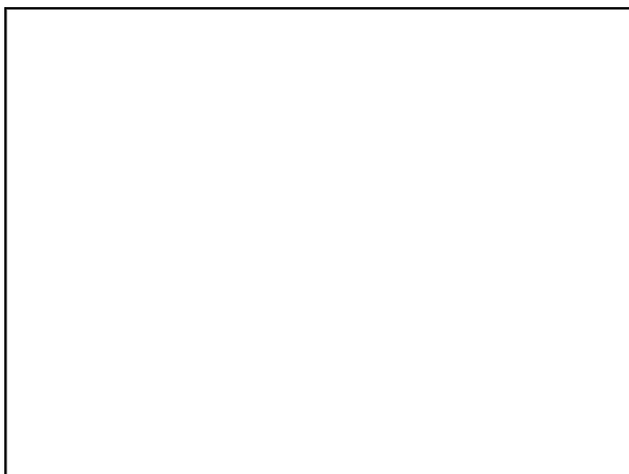
Test de cyclabilité des rues de Vitré

Soumis au vote de l'assemblée générale du 5 décembre 2014 à Vitré.